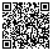
線上報名 QR code