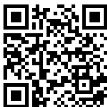
未滿 15 歲保險表單 QR code

未滿 15 歲保險表單 https://forms.gle/ap6Z3bKhym1fkz8n9